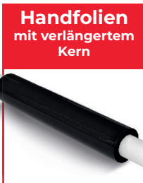
Handfolien mit verlängertem Kern